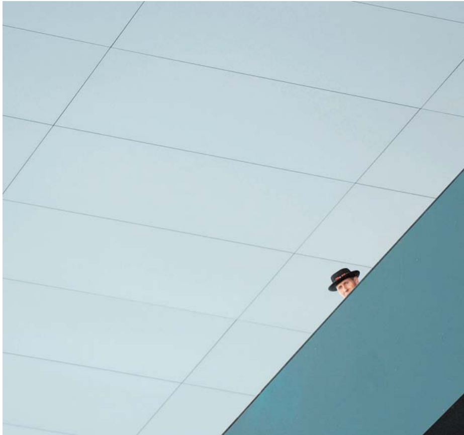
Sie sind überall: Sogar ins Luzerner Konzerthaus dürfen sie während des Jodlerfestes.