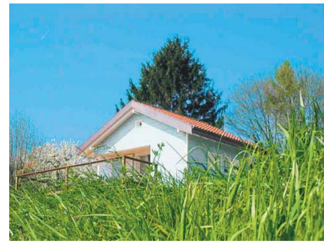
Klein, aber mit großer Aussicht

man hier dazu. Man mag sie nicht sonderlich, die Franzosen von gegenüber, die immer wieder versuchen haben, das Land zu erobern, bis die Genfer sie in die Flucht schlugen, das letzte Mal im Kampf gegen Karl Emanuel von Savoyen in einer Dezembarnacht im Jahre 1602. Und man ist nicht böse, dass die Savoyer, was den Ausblick angeht, rund um den Genfer See eindeutig die Verlierer sind: Der Blick von Frankreich auf die Schweizer Seite ist unspektakulär, das Relief der Voralpen ist mit dem Chablais nicht zu vergleichen, und die waadtländische Kapitale Lausanne in der Mitte ist – nun ja, eine Stadt eben.