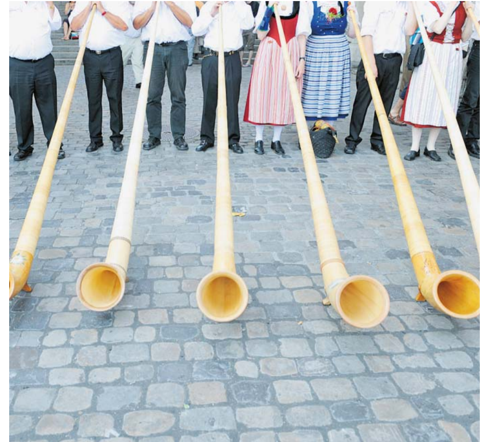
Und wenn sie nicht mehr jodeln, blasen sie noch heute in die Alpenhörner.

Ja, ju, du oder dö? Während des Jodlerfestes herrscht in Luzern der Ausnahmezustand